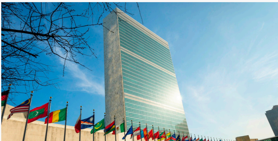
Siège des Nations Unies, New York, États-Unis.

La pauvreté a chuté à des niveaux historiquement bas en Afrique du Sud depuis le lancement d'un revenu universel de soins, transformant les activités de soin et le travail communautaire en emplois rémunérés. P. 25