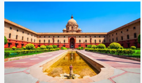
Ministerio de Finanzas, Nueva Delhi, India.

"Un impuesto sobre el daño ambiental garantiza que los responsables de la contaminación contribuyan a las soluciones", dijo un alto funcionario del Ministerio de Finanzas.